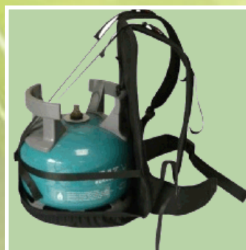
Sac à dos pour bouteille 6 kg