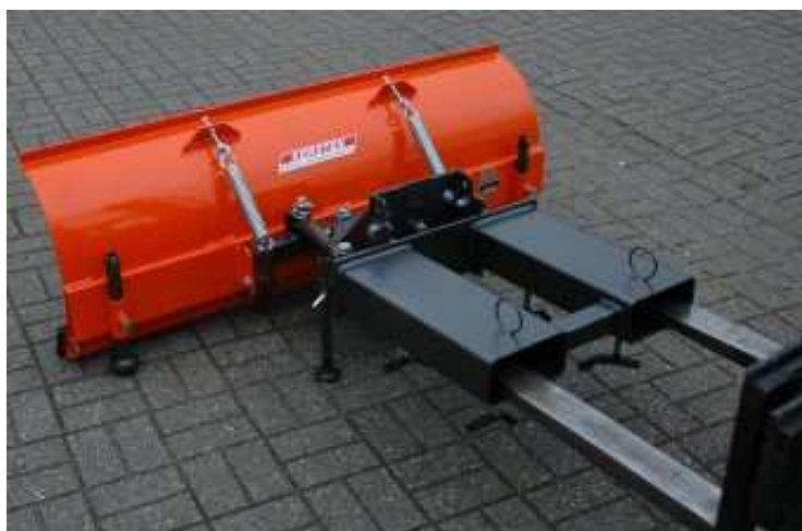
Photo 1 Fixation sur le chariot